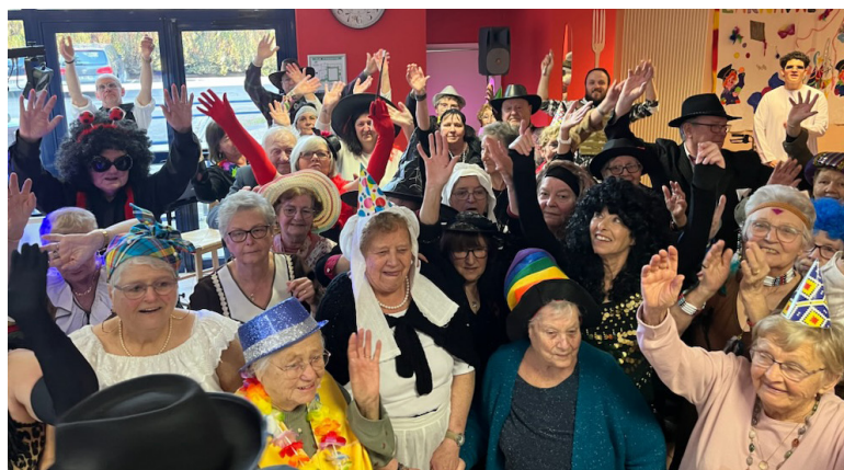
L'après-midi crêpes party de l'APEGES - Mercredi 22 février