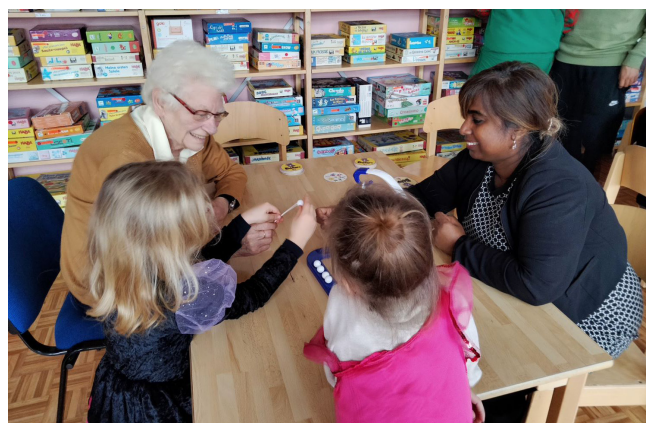
Les séances intergénérationnelles proposées par la ludothèque aux résidents des Sapins Bleus.