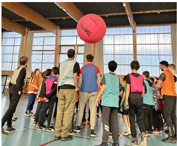
Le tournoi de kinball du Centre Social CAL Docteur Nuyts - vacances de février