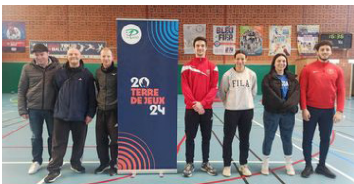
Le centre sportif municipal - vacances de février