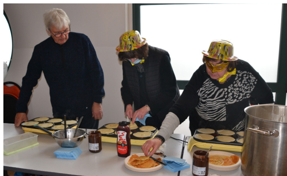
La pâte à crêpes a été préparée par la cuisine centrale des Petits Gourmets.