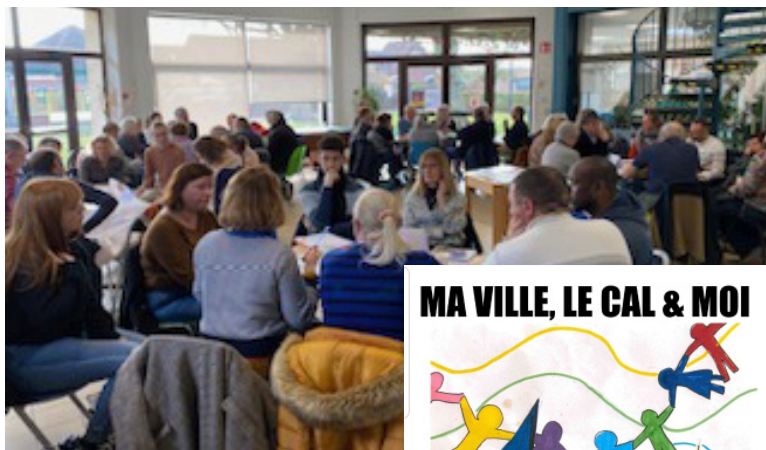
La journée d'échanges du Centre Social CAL Docteur Nuyts Jeudi 9 février