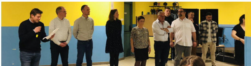
La soirée familiale de l'USP Football - Samedi 21 janvier