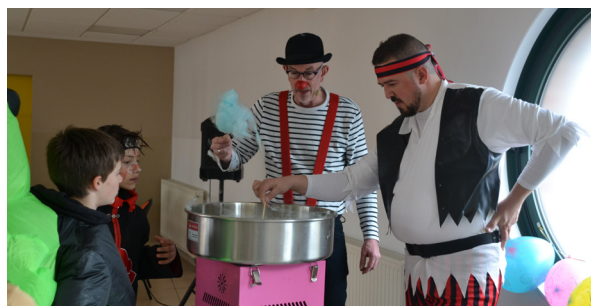
Le carnaval du CMJ - Samedi 4 mars