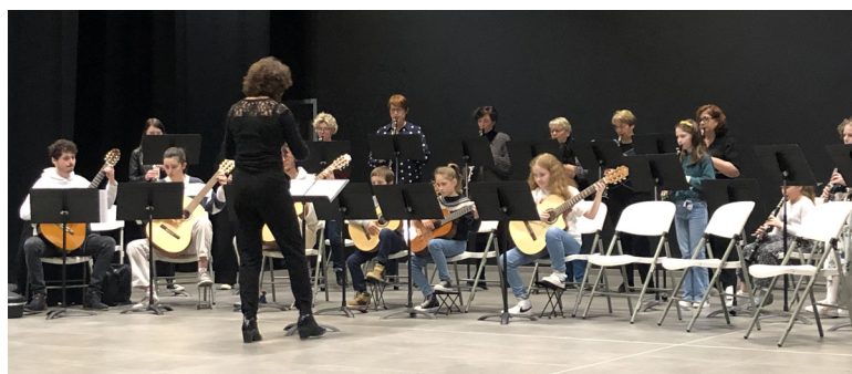
Les auditions de l'espace musical - Centre Social CAL Docteur Nuyts Les classes de guitare et de clarinette.