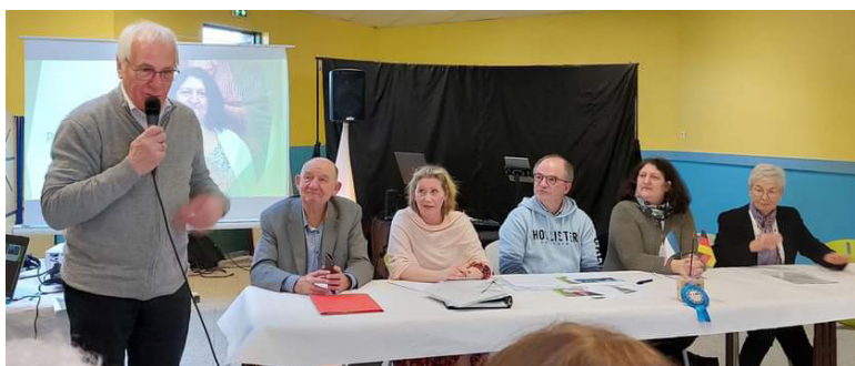
L'assemblée générale des Amis d'Overath - Dimanche 26 février